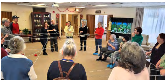
Formation annuelle des bénévoles à Saint Brigid's, souvent organisée le jour de la Saint-Brigid ou à une date proche.