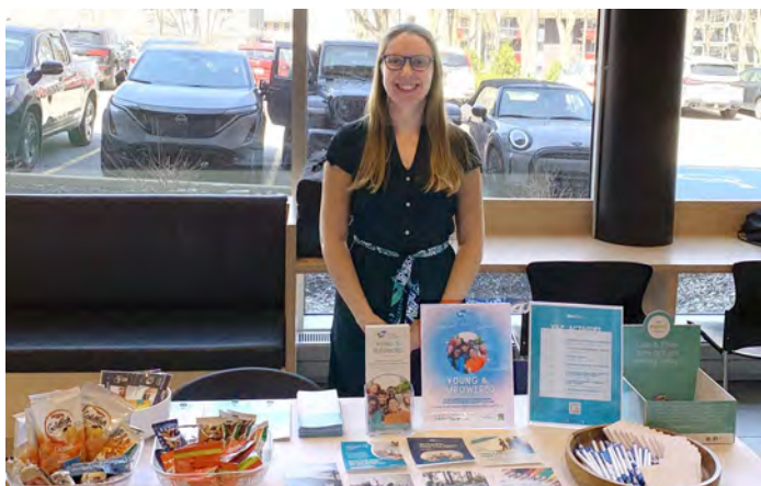
Informier et responsabiliser les jeunes leaders de notre communauté.