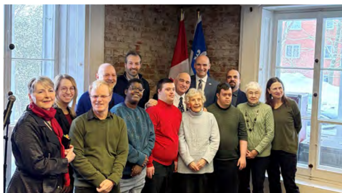
L'annonce du financement a eu lieu à la Maison Mary Gillespie le 3 février 2025.