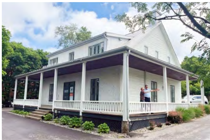
Notre Maison Mary Gillespie sur l'Avenue Moreau à Sainte-Foy.

Au fond, ce projet vise à favoriser les liens et l'appartenance. Nous créons un espace où les gens peuvent se réunir, nouer des relations et renforcer notre communauté.