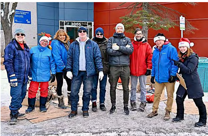
S'unir une fois de plus pour Faire preuve de bonté.