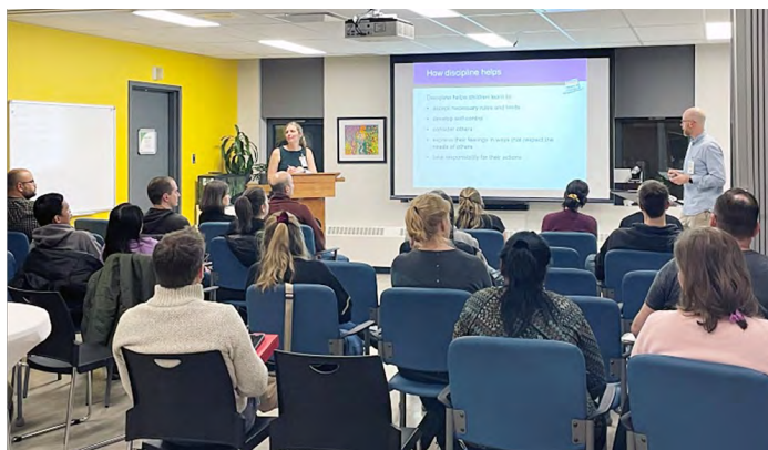
Nos sessions Triple P sur la parentalité ont été un grand succès.