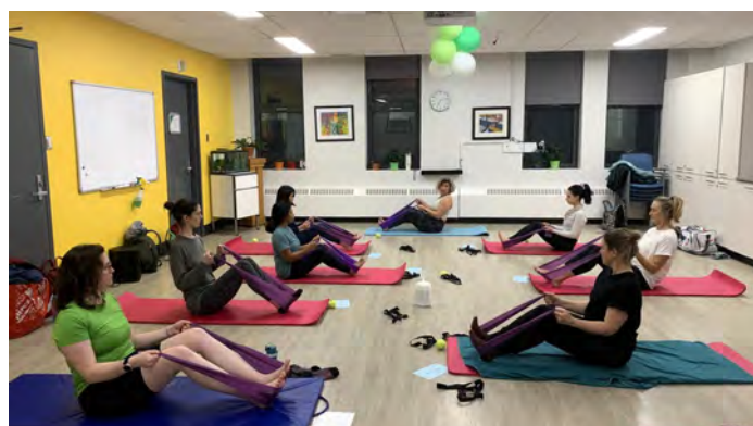
Activités visant à promouvoir le bien-être du corps et de l'esprit.