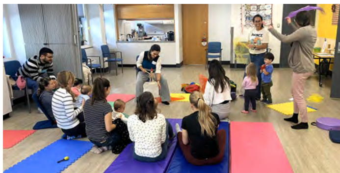
Les « Munchkins » musicaux étaient l'une de nos 3 nouvelles activités populaires