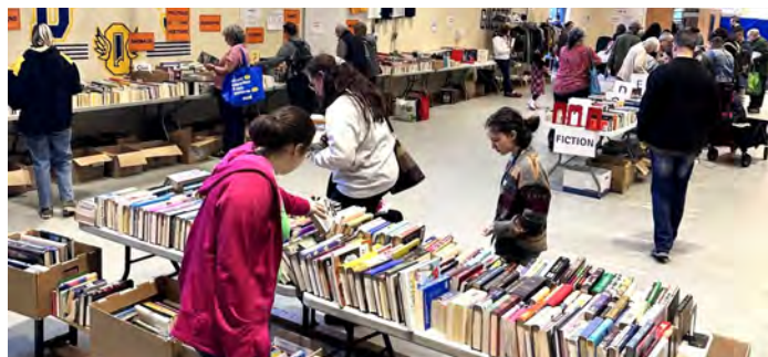
Nous aidons Entrepreneurs SNACS à organiser la Foire du livre.

Les Partenaires JH fournissent un soutien en matière de ressources humaines aux organisations à but non lucratif suivantes dans notre communauté : La Corporation de logement communautaire de Holland, qui gère le Manoir McGreevy ; Entrepreneurs SNACS , qui organise chaque année une Foire aux livres afin de collecter des fonds pour aider les jeunes ayant des besoins particuliers ; et la Guilde Saint Brigid's, qui collecte des fonds principalement pour soutenir les résidents. Nous remercions tout particulièrement ces associations qui contribuent à améliorer la vie de tant de gens.