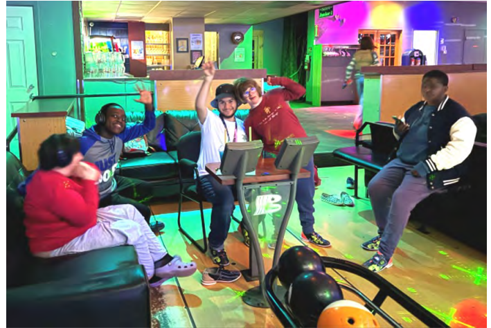
Offrir un répît en organisant des soirées repas et des soirées bowling.