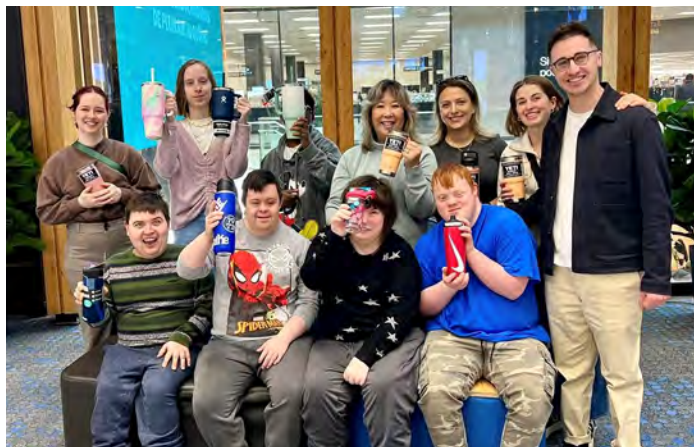
Le programme RISE : Créer de la joie et libérer le potentiel.

aux livres de l'automne 24 de SNACS Entrepreneurs et vente de collations lors de cet événement.